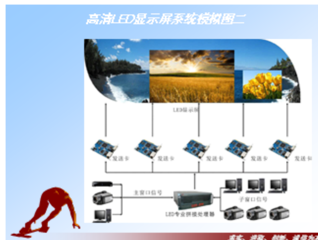
高清 LED 显示屏系统模拟图二